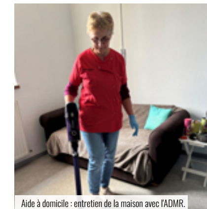
Aide à domicile : entretien de la maison avec l'ADMR.