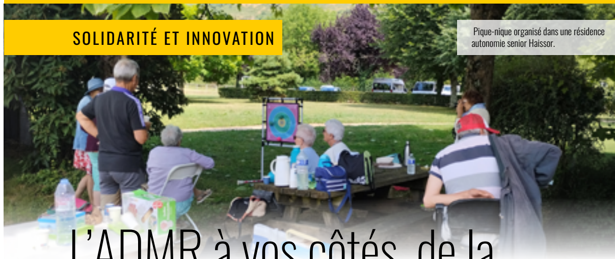
Pique-nique organisé dans une résidence autonomie senior Haissor.