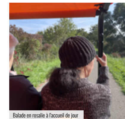
Balade en rosalie à l'accueil de jour