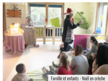
Famille et enfants - Noël en crèche

un avantage indéniable pour les parents aux horaires décalés : un accueil de 6 h à 19 h 30 ou 20 h 30. L'accès à ces solutions d'accompagnement de la vie de famille ouvre le droit aux allocations de la CAF ou de la MSA en fonction des revenus du foyer, avec un éventuel reste à charge pour les bénéficiaires. Une association dédiée de techniciens de l'intervention sociale et familiale (TISF), rattachée au pôle Enfance et parentalité de l'ADMR, apporte quant à elle un soutien aux familles de la grossesse à la vie de l'enfant. Un appui qui va du conseil en puériculture à l'aide aux démarches administratives en passant par des actions éducatives telles que jeux ou aide aux devoirs, et même des recommandations d'aménagement de la maison... Cette équipe est également chargée de la